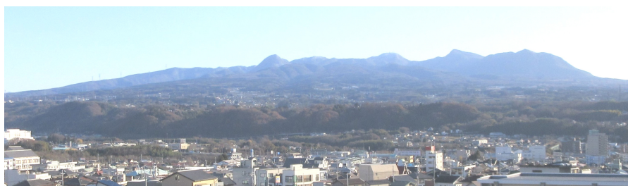
渋川商工会議所屋上より撮影 「赤城山」

令和7年の新春を迎え、謹んでお慶び申し上げます。皆さまにおかれましては、日頃から商工会議所の事業活動に多大なるご支援・ご協力を賜り、厚く御礼申し上げます。