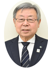
澁川市市長 高木 勉

新年あけましておめでとうございます。皆様におかれましては、輝かしい新春をお迎えのことと心よりお慶び申し上げます。澁川商工会議所会員の皆様におかれましては、商工業の振興と発展のため、日夜ご尽力いただいておりますことに心より敬意を表するとともに、市政の推進に格段のご理解とご協力を賜り、厚く御礼申し上げます。