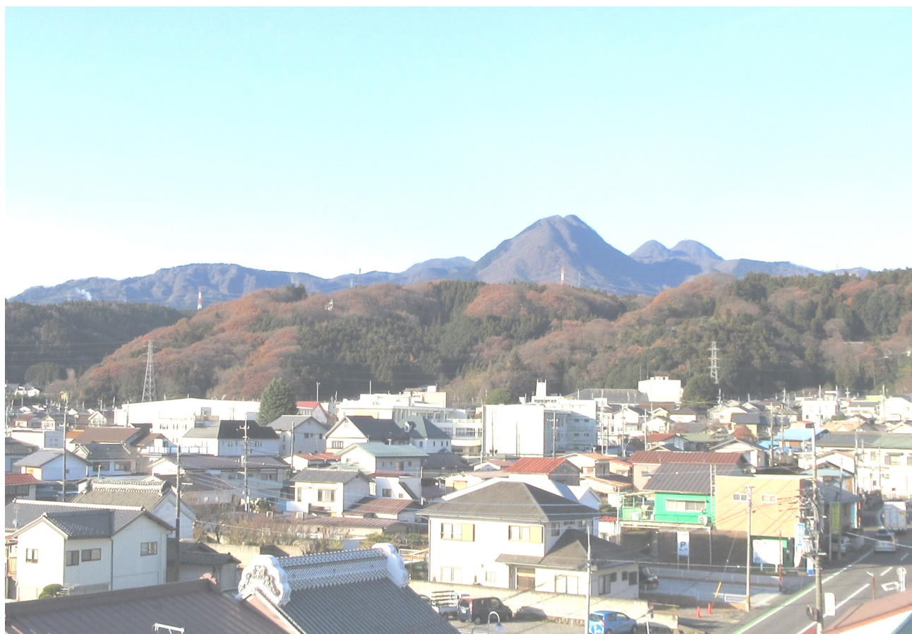
渋川商工会議所屋上より撮影 「榛名山系」