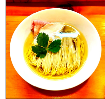
「看板メニューの醤油らぁ麺」 (上) 醤油らぁ麺 黒 (下) 醤油らぁ麺 白