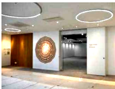
改装中のギャラリー