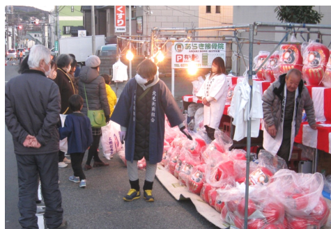
だるまを買い求めに賑わう

だるま買い求める 恒例の初市開催 1月12日（金）午前11時から午後9時まで、渋川郵便局前通りを中心に新春恒例の初市が開催されました。 コロナ禍明けの開催となり好天にも恵まれ、絶え間なく来場者があり、だるま等縁起物を購入される姿が多く観られました。