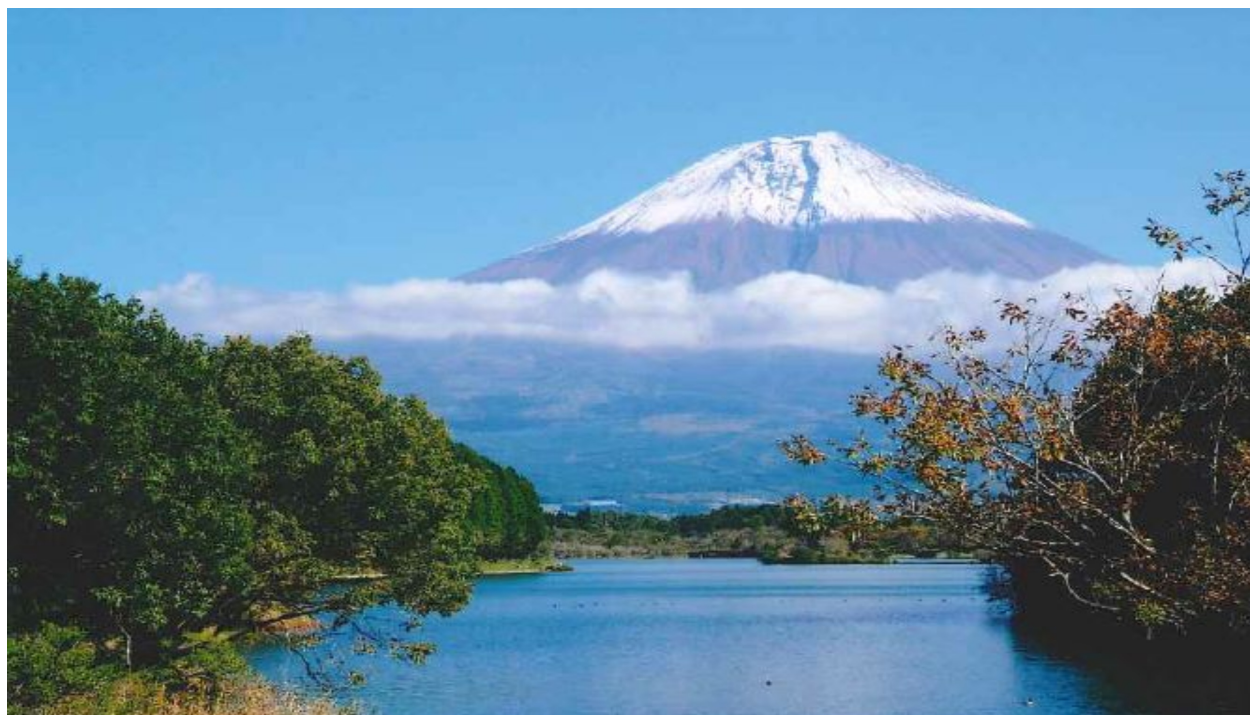
「河口湖越しに見た富士山」