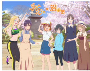
なれなれプロジェクト/菜なれ花なれ製作委員会

【詳細はこちら】 アニメファンド 公式サイト https://animefund.com/project/narenare