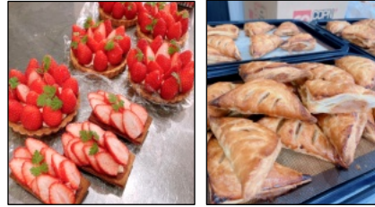
人気メニューのイチゴタルトとアップルパイ

また、実際にお菓子作りの楽しさを味わって頂きたいと「お菓子教室」を定期的に開催しています。ご家族連れや友人同士、お1人でも気軽に参加出来るアットホームな雰囲気です。リピーターを増やして頂きます。 店名の「ボノボノ」の由来は、お菓子を通じてお客様に「ほのぼのとした気持ちになっ」て頂きたいといった意味が込められているそうです。 今後は、「色々なイベントに出店させて頂きたいです」と話して下さいました。 是非、お菓子作りを体験してみたいか、お菓子作りを体験してみたいか、お菓子作りを体験してみたいか。