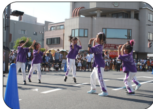
キッズストリートダンス