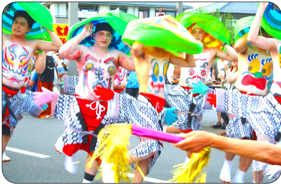
4年ぶりのへそ踊りパレード

7月29日（土）新町五差路を中心に第40回渋川へそ祭りが開催され、7万5千人が訪れ市内は活気につつまれました。 午後3時より祭り開始のセレモニーが行われ、新町五差路の路上パフォーマンズ会場にて各種イベントが開催されました。