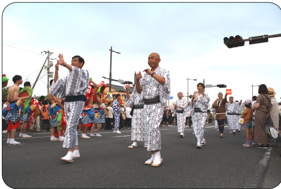
婆涼し気な浴衣踊り

夕方6時から行われたへそ踊りパレードは、企業など13団体からの申し込みと当日の飛び入り参加者を含め約430人がエントリーされました。 「へそ出せヨイヨイ、腹出せヨイヨイ」のへそ音頭に合わせたパレードが渋川の夏を彩りました。