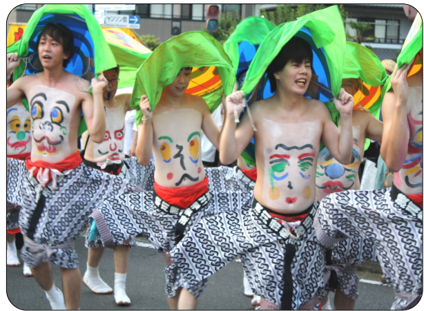
へそ祭りパレード