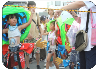
ちびっこへそ踊りパレード