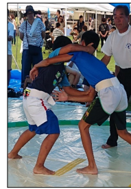
土師(どし)の辻 子供相撲大会の様子