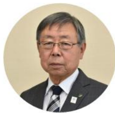
澁川市長 高木 勉

結びに、新年を迎えるにあ たり、会員皆様の事業発展を ご祈念申し上げますとともに 今年一年皆様のご多幸とご健 勝を心よりお祈りし新年の挨拶 と致します。