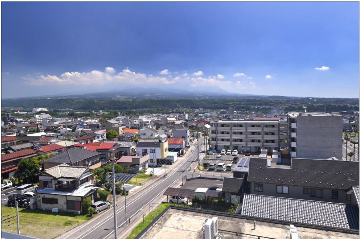
写真「当所屋上から望む赤城山」