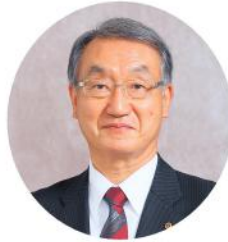
(一社)群馬県商工会議所連合会

100年に向けて、本年が、「日本再生・変革に挑む」ための力強い一歩を踏み出す年となるよう、スピード感をもって実行していく組織、志を高く、新しい時代を切り拓いていく組織を目指してまいります。皆さまの一層のご支援とご協力を心からお願ひ申し上げます。