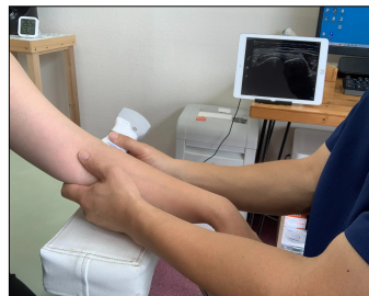
安心のエコー診療