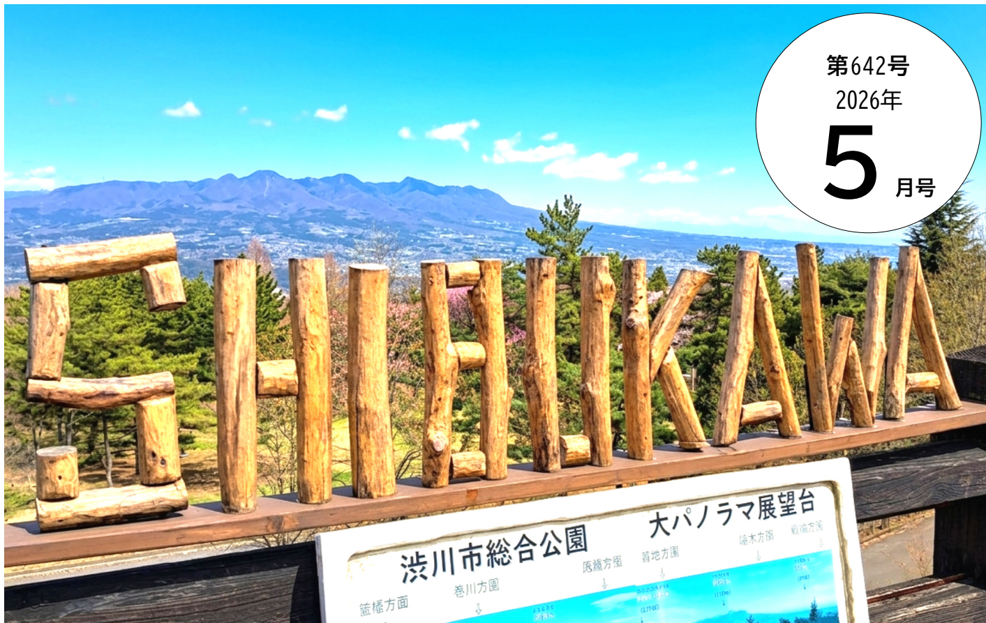
【渋川市総合公園の大パノラマ展望台より】