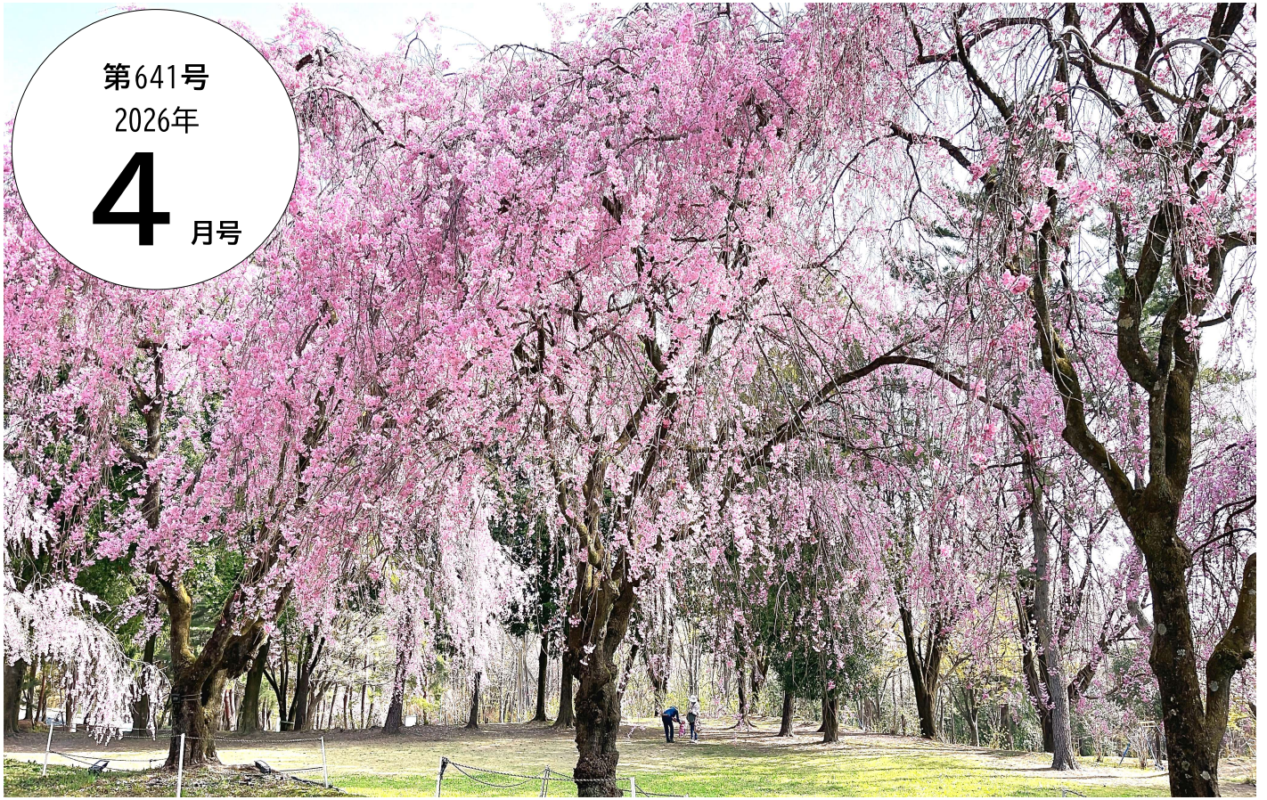
【渋川市総合公園の桜(昨年撮影)】