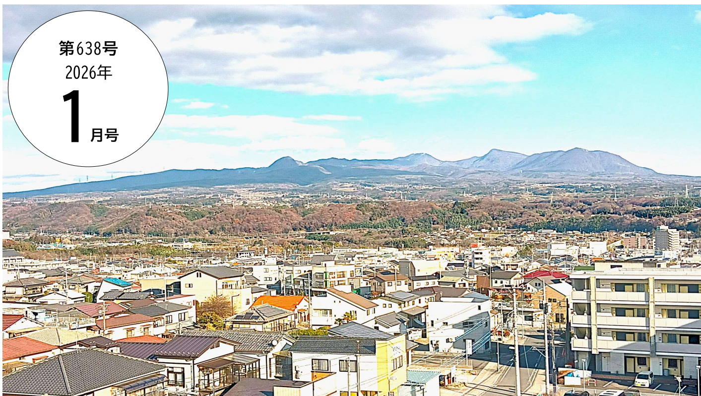
【渋川商工会議所屋上より撮影：赤城山】