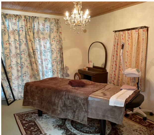
【落ち着いた雰囲気の施術ルーム】