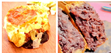
【しぶかわ推しに認定された お好み焼風とうす皮極盛あんこ】