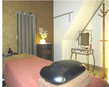
【エキンチックな雰囲気店内】