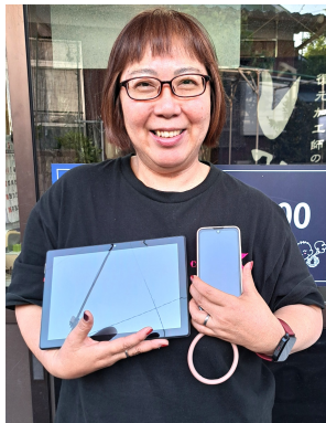
パートスタッフの方のスマホやタブレットメガネ、スマートウォッチがピカピカに！

あり、通常の色を抜くシミ抜きでは無く、独自の脱色法や染料の配合により色掛け、衣類を元の状態に復元するシミ抜きをされています。 「大事な洋服をもう一度着たいと言うお客様の要望にお答えできる様一着一着に誠心誠意向き合い、努めて行きたいです。また、クリーニング業の傍ら、スマートフォン・タブレット・メガネ・時計等のガラスコーティングのサービスを始めました。是非合わせてご利用いただきたいです」とお話くださいました。