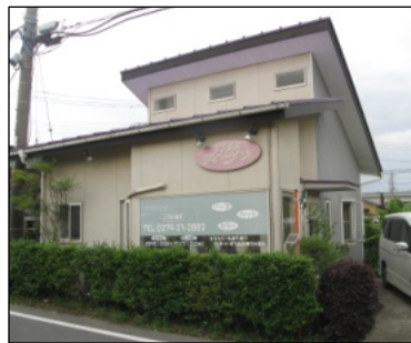
白が基調でピンクの看板がアクセントの店舗外観