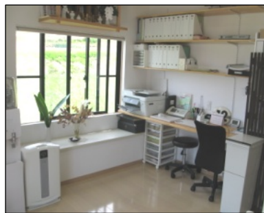
白を基調としたおしゃれな事務所内