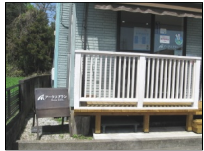
自宅に併設されている事務所外観