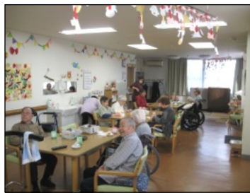
ゆったり寛ぐ利用者の方々