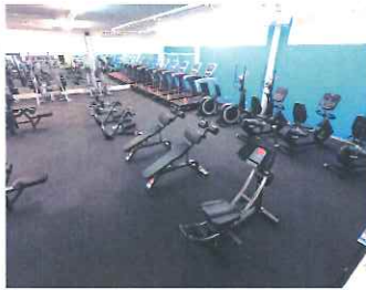
種類豊富なトレーニングマシン