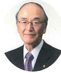
日本商工会議所 会頭 三村 明夫