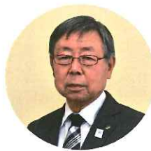
渋川市長 高木 勉

結びに、新年を迎えるにあ たり、会員皆様の事業発展を ご祈念申し上げますとともに 今年一年皆様のご多幸とご健 勝を心よりお祈りし新年の挨拶 と致します。