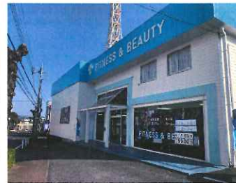
目を引く店舗外観