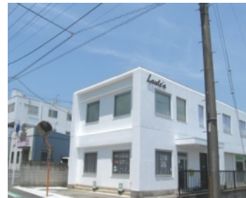
白を基調とした外観