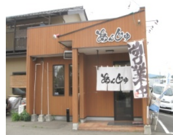
ストップコロナ！ 対策認定店