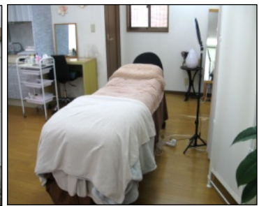
完全プライベートの店内