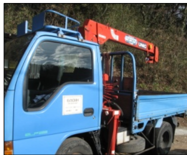
現場に向かう作業車