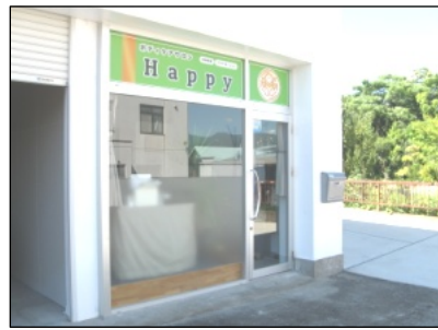
白を基調とした明るい外観