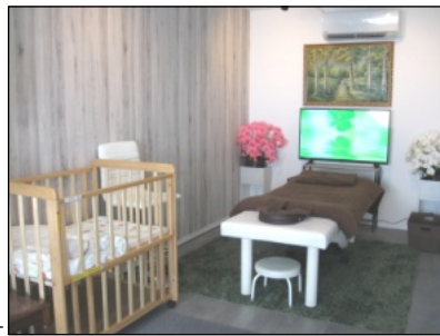
小さなお子様連れの方も安心して施術可能