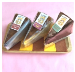
人気商品のビター、安納芋チョコ Mint