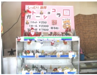
直売所内のコーナー