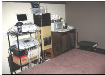
充実している美容機器