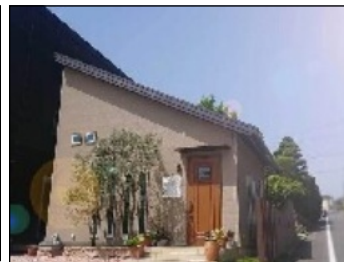
住宅地に佇む店舗外観